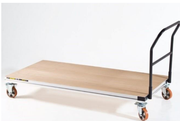
wózki transportowe / magazynowe