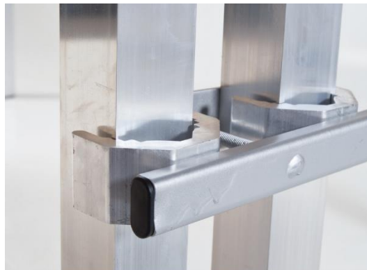
uniwersalna klamra łączeniowa do nóg