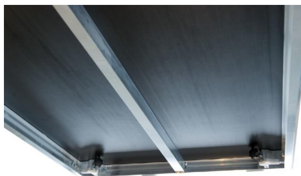
zwiększenie stabilności podestu za pomocą wspornika

Standardowe nogi: kwadratowa rura 60x60mm