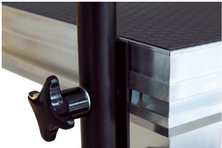
mocowanie barierki do ramy podestu