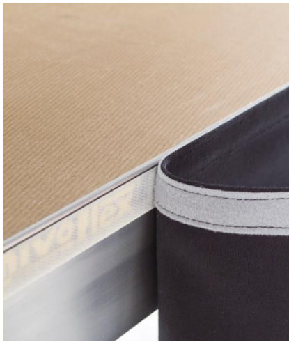
mocowanie osłony tekstylnej