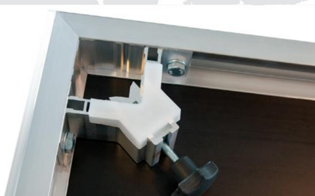
narożnik do nóg gwarantuje błyskawiczny montaż

Lekki podest sceniczny z wymiennymi nogami na każdą okoliczność. Ergonomiczny, wielofunkcyjny profil zaprojektowany został tak, aby zapewnić proste i mocne połączenie ze sobą podestów i wszelkiego rodzaju akcesoriów typu schody, barierki, blendy itp.